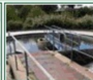
Colectividades Depuradoras Fosas sépticas